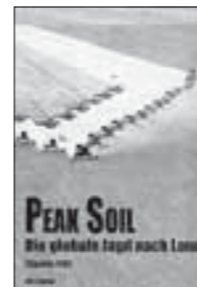
Peak Soil: Die globale Jagd nach Land. Thomas Fritz; FDCL-Verlag, Berlin 2009; 164 S.

Angelehnt an den Begriff «Peak Oil», der das Produktionsmaximum von Erdöl meint, betitelt Thomas Fritz sein Buch zur globalen Jagd nach Land mit «Peak Soil». Wie Öl, sind auch die Landreserven dieser Erde begrenzt. Sie sollten vorab der Ernährung dienen. Wer damit spekuliert, so zeigt das Buch, gefährdet die Ernährungssicherheit. Die Aneignung grosser Flächen fruchtbarer Landes konkurrenziert die kleinen Produzenten, verschärft den Landdruck und führt wegen der industriellen Anbaumethoden zu einer Übernutzung der Böden und weiterem Landverlust.