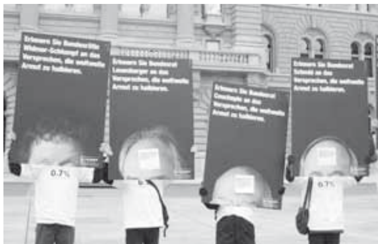
Der Bundesrat sperrt sich gegen mehr Entwicklungshilfe – und foutiert sich einmal mehr um die Millenniumsziele. Aktion vor dem Bundeshaus, 2008.

Der Bundesrat verwarfte sich auch dagegen, nach 2010 eine Zusatzbotschaft vorzulegen, sollten sich dazumal zusätzliche Mittel als nötig erwei-