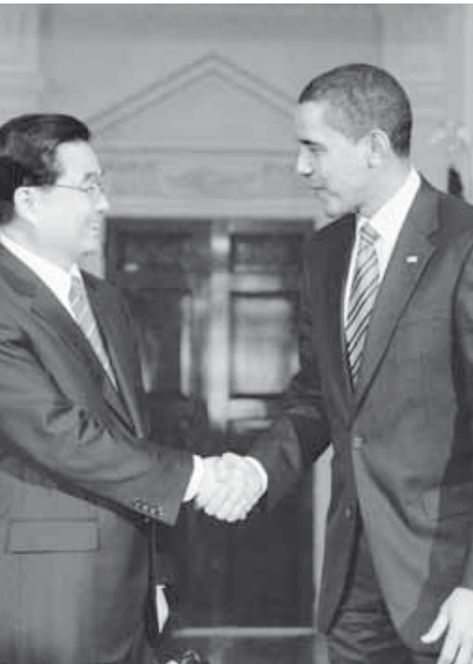
Vor einer Neuverteilung von Macht und Verantwortung: Barack Obama trifft am G-20-Gipfel in London den chinesischen Staatschef Hu Jintao.