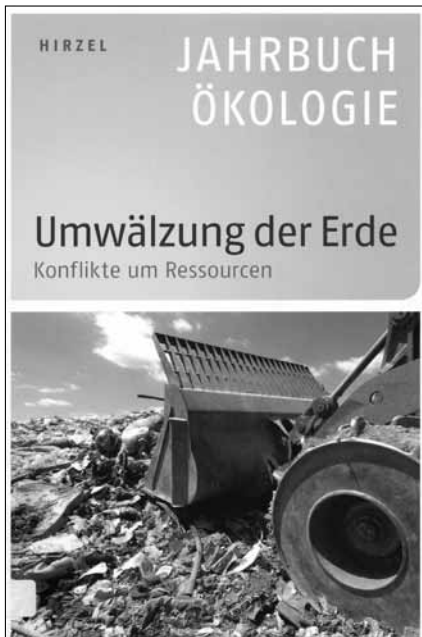
Jahrbuch Ökologie 2010 – Umwälzung der Erde. Konflikte um Ressourcen. Hirzel Verlag; Stuttgart 2009; 248 S.

Öl, Wasser, Land, Metalle werden immer knapper. Entsprechend verschärfen sich die Konflikte um natürliche Ressourcen. Das «Jahrbuch Ökologie 2010» analysiert unter dem Titel «Umwälzung der Erde» diesen