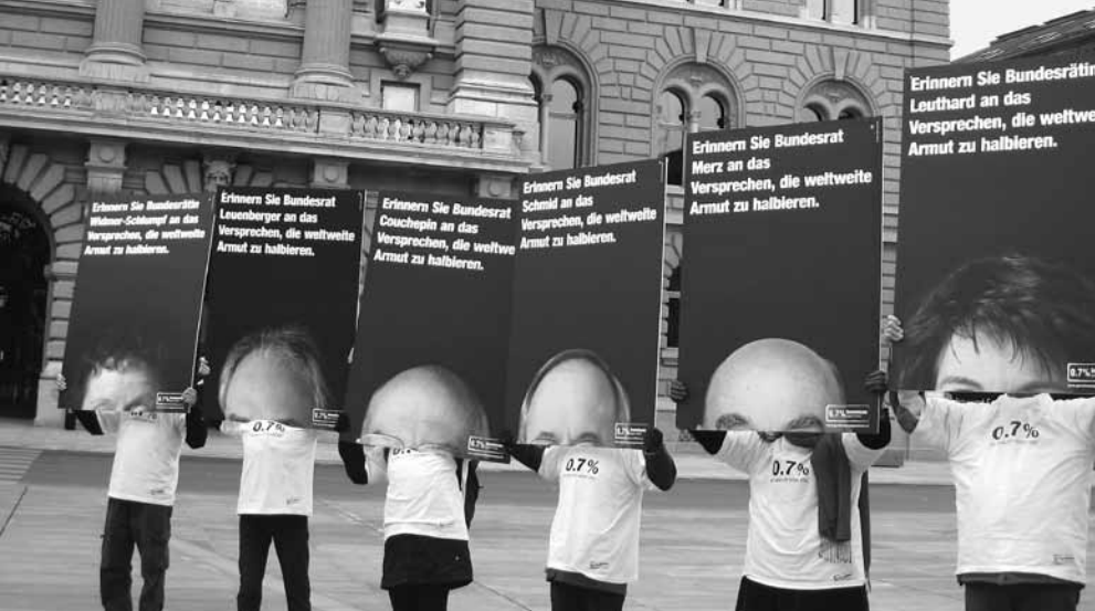
Köpfe wechseln, die Verpflichtung bleibt: Alliance Sud erinnert den Bundesrat an seine Unterschrift unter die Uno-Millenniumsziele (2008).

Patentschutz behindert sie den Zugang zu Arzneimitteln und schränkt Kleinbauern bei der Nutzung von Saatgut ein. Sie verlangt die Liberalisierung des Handels mit Industriegütern und ignoriert dabei die grosse Bedeutung der Importzölle für Entwicklungsländer, die Mittel für die Armutsbekämpfung generieren und den Aufbau von nationalen Industrien und Arbeitsplätzen fördern (vgl. Artikel S. 5).