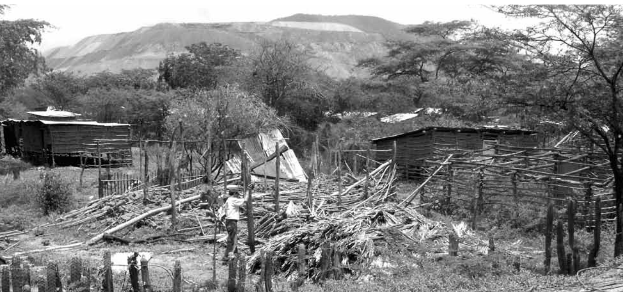
Malgré des plaintes contre Xstrata et d'autres entreprises, de plus en plus de villages sont rasés.

Michel Egger Malgré leurs faiblesses et leur caractère volontaire, les Principes directeurs de l'OCDE constituent l'ensemble de normes sociales et environnementales le plus important pour les multinationales. Une révision vient d'être lancée, qui devrait durer une année. L'occasion de corriger leurs principales faiblesses et d'inciter la Suisse à renforcer ses propres structures.